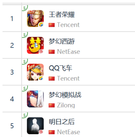
图 15：App Store 中国区畅销榜 TOP5

App Store 2018 年 1 月 4 日数据中国区畅销榜下载量排行前三： 腾讯《王者荣耀》 、 网易《梦幻西游》 、 腾讯《QQ 飞车》 ，紫龙《梦幻模拟战》排名第四， 网易《明日之后》 排名第五。