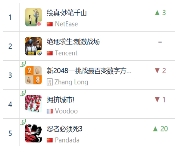
图 14：App Store 中国区免费榜 TOP5

App Store 2019 年 1 月 4 日数据中国区免费榜下载量排行前三： 网易《绘真·妙笔千山》 、 腾讯《绝地求生：刺激战场》 、 掌龙《新 2048—挑战最百变数字方...》 ，Voodoo《拥挤城市！》排名第四，Pandada《忍者必须死 3》排名第五。