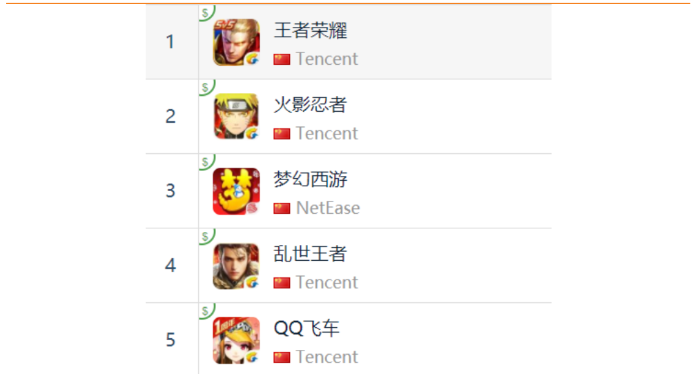
图 15：App Store 中国区畅销榜 TOP5

App Store 2019 年 1 月 11 日数据中国区畅销榜下载量排行前三： 腾讯《王者荣耀》 、 腾讯《火影忍者》 、 网易《梦幻西游》 ，第四名和第五名为腾讯《乱世王者》和《QQ 飞车》。