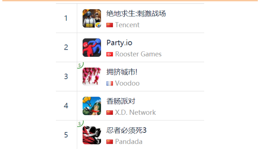
图 14：App Store 中国区免费榜 TOP5

App Store 2019 年 1 月 11 日数据中国区免费榜下载量排行前三： 腾讯《绝地求生：刺激战场》 、Rooster Games《Party.io》、Voodoo《拥挤城市！》。