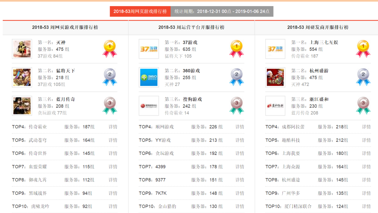
图 12：网页游戏开服排行（单位：组）

12月31日-1月6日网页游戏开服前三：《灭神》、《猛将天下》、《蓝月传奇》；运营平台开服排行前三：37游戏、360游戏、搜狗游戏；研发商开服前三：上海三七互娱、杭州盛游、浙江盛和。