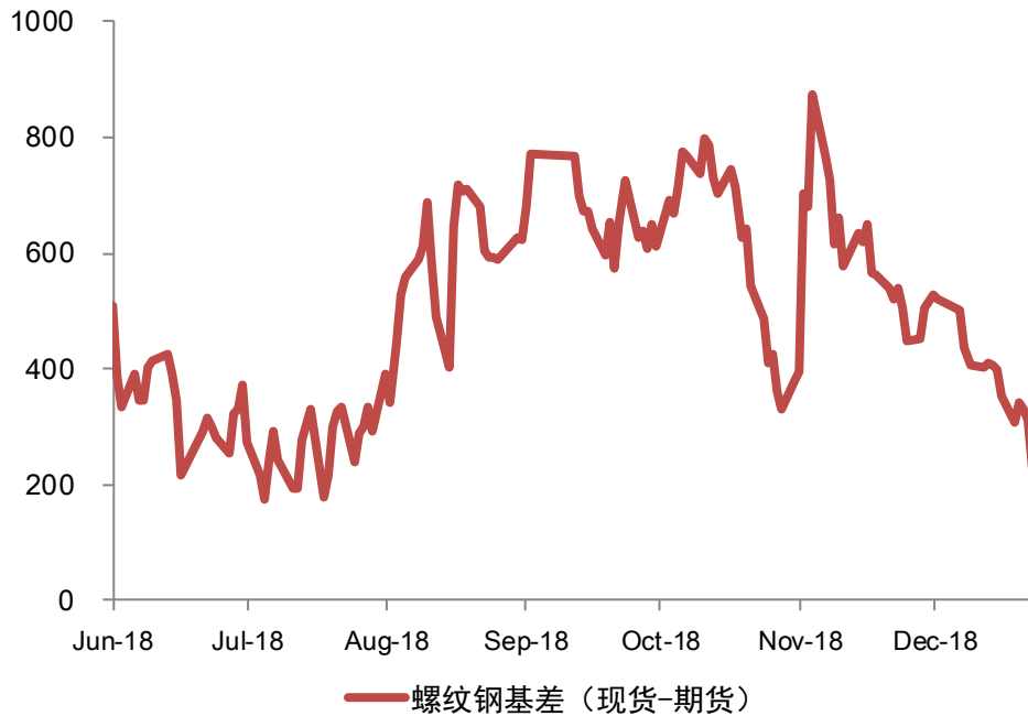
图表：螺纹基差监测