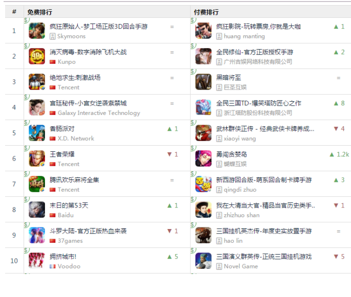
图表11: 2019年第8周(2.18-2.24) App Store 游戏

本周 App Store 中国区游戏榜免费榜排行前三的分别为 天象互动开发的“疯狂原始人-梦工厂正版 3D 回合手游”、成都蓝飞互娱的“消灭病毒-数字消除飞机大战”和腾讯旗下“绝地求生·刺激战场”; 安卓豌豆荚游戏榜下载量排行前三中, 腾讯旗下热门游戏“王者荣耀”和“绝地求生·刺激战场”分列第一、二名, 乐元素科技股份有限公司开发的“开心消消乐”位列第三。