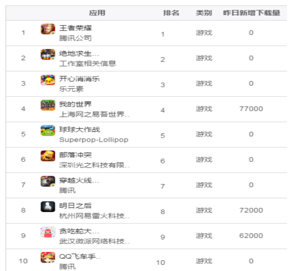
图表12: 2019年第8周(2.18-2.24) 豌豆荚游戏