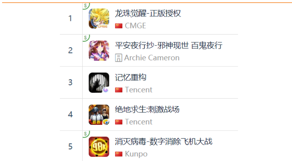
图 13：App Store 中国区免费榜 TOP5

App Store 2019 年 3 月 1 日数据中国区免费榜下载量排行前三：中手游《龙珠觉醒》、Archie Cameron《平安夜行潮-邪神现世 百鬼夜行》、腾讯《记忆重构》。腾讯《绝地求生：刺激战场》排名第四。