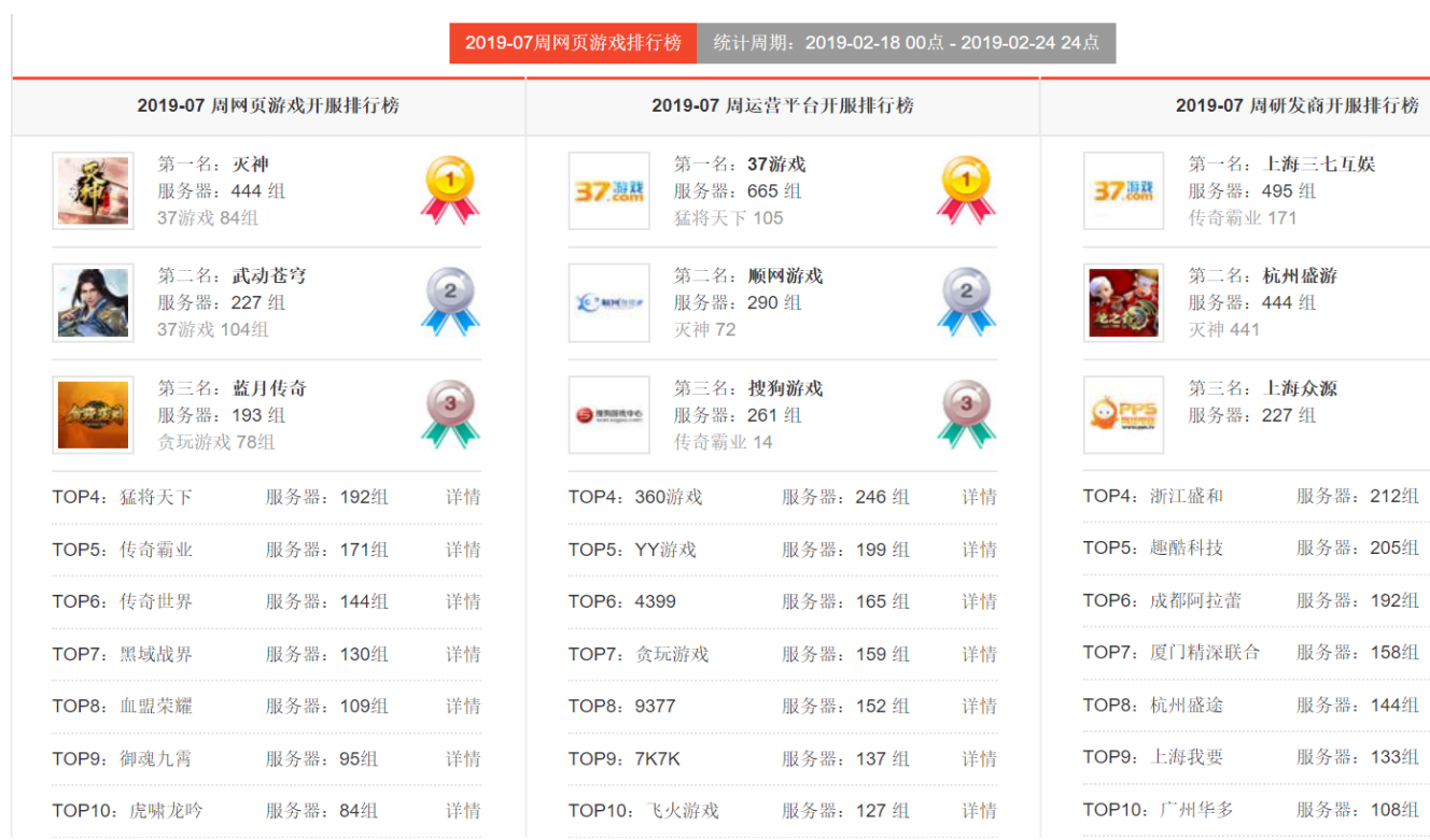
图 12：网页游戏开服排行（单位：组）