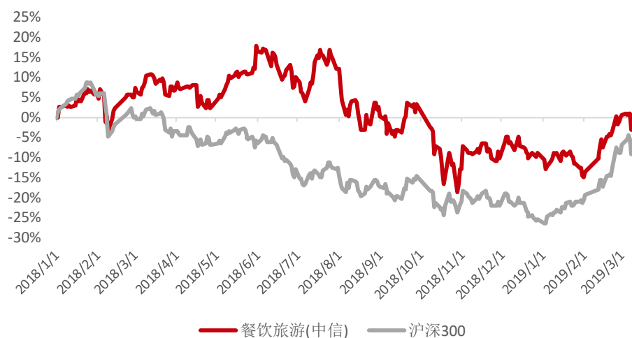
图 1： 餐饮旅游指数与沪深 300（2018 年至今）

本周，餐饮旅游指数相对沪深 300 指数下跌 0.80%，其中餐饮旅游指数下跌 3.77%，沪深 300 指数下跌 2.46%。