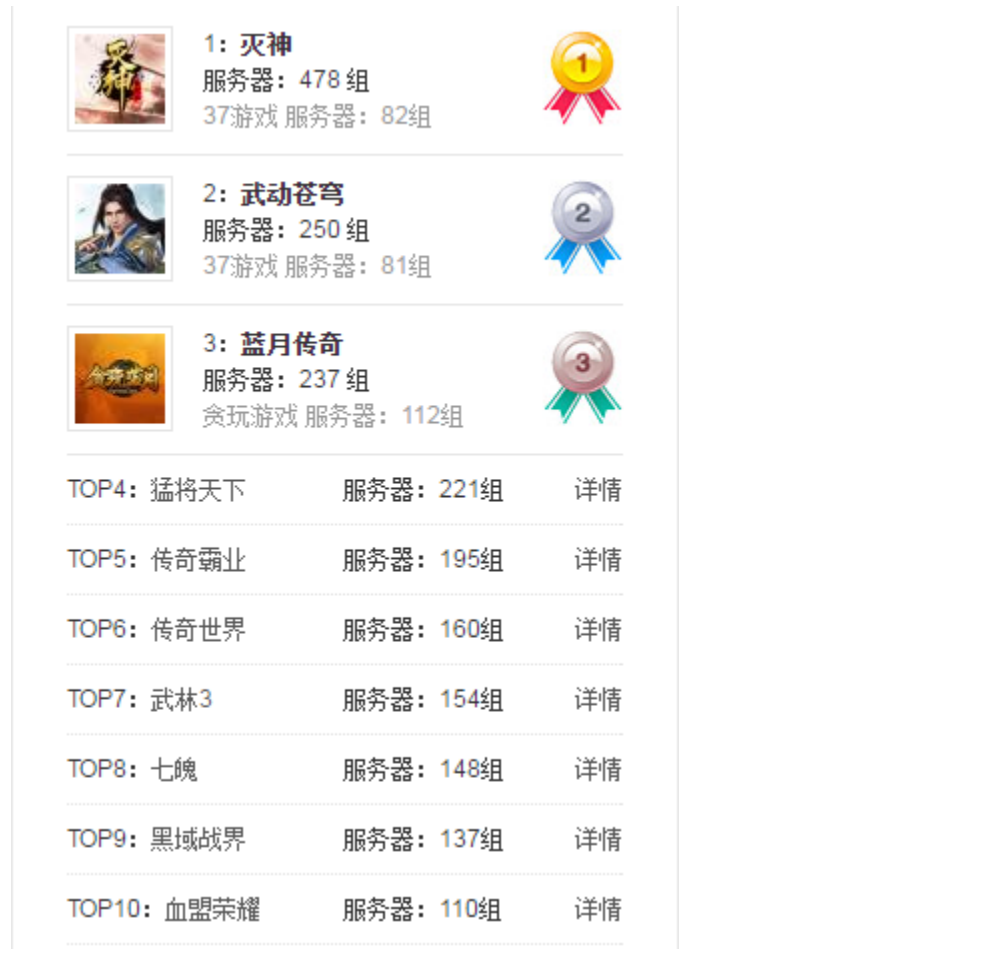
图表8： 2019 年第 9 周（3.03-3.10）页游排行 TOP10

传奇》分别开服 250 组和 237 组列第二、三位。第 3—10 名中，有越来越多的厂商挤进榜单，传统大厂三七互娱、恺英网络和盛大游戏的优势不再突出，页游或将进入百家争鸣格局。