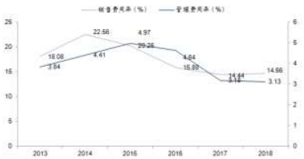
图 3: 2013A-2018A 销售、管理费用率 (%) 一览