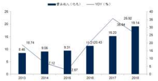
图 1: 2013A-2018A 营收 (亿元) 及增速 (%)

公司近三年营收先高后低，归母净利润近三年增速放缓，主因公司进行全国化扩张投放市场费用、提价效应等所致。