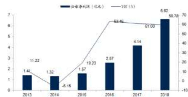
图 2: 2013A-2018A 归母净利润 (亿元) 及增速 (%)