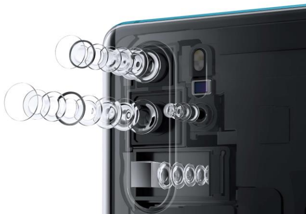
图表2 华为 P30 Pro 四摄