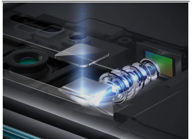
图表3 潜望式长焦镜头