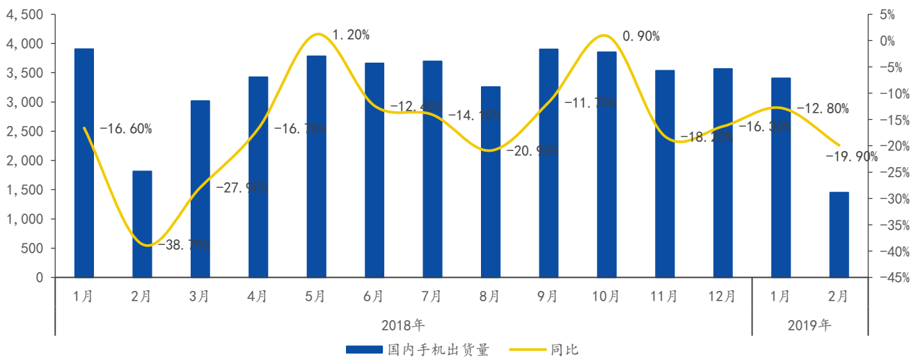
图 3: 国内手机市场出货量情况

全球智能手机市场已经进入成熟阶段, 其出货量在 2017 年出现下滑。从地区来看, 中国市场出货量下滑更为严重, 根据中国信息通信研究院最新发布的报告《2019 年 2 月国内手机市场运行分析报告》, 2019 年 2 月国内手机市场总体出货量 1451.1 万部, 同比下降 19.9%, 下滑幅度高于全球平均水平。