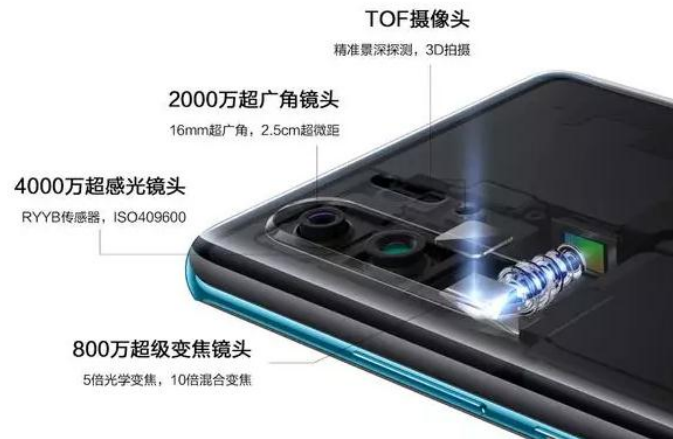
图 2: P30 Pro 后置潜望式镜头