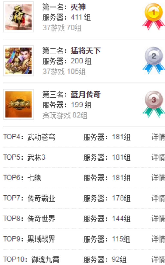
图表8： 2019 年第 13 周（4.01~4.07）页游排行 TOP10

较上周开服减少 20 组。杭州盛游的《灭神》开服 411 组位居第一；成都阿拉蕾的《猛将天下》和盛和网络科技的《蓝月传奇》分别开服 200 组和 199 组列第二、三位。