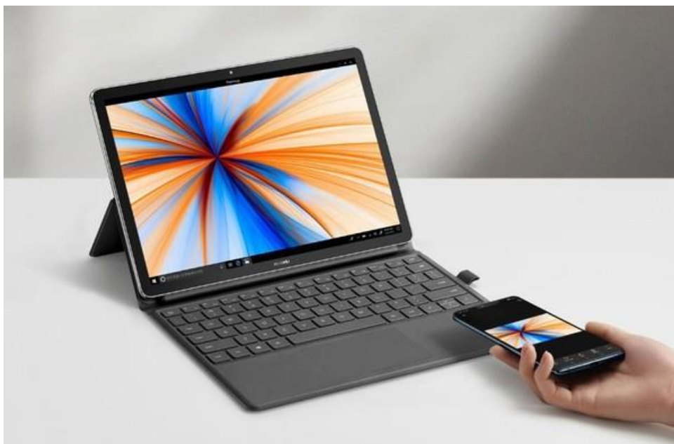
图 3：HUAWEI 一碰传

延续 HUAWEI 一碰传功能，新增“一碰传录屏”。 在文件传输方面，新款华为 MateBook E 同样作出了更新升级。该机笔记本电脑内置了华为全新的 Huawei Share 一碰传功能，可以让 Office 文件在 PC 和手机之间的双向互传，传输速率最高可达 30MB/s，2 分钟可传输 1GB 大小的文件，一次性最多传输 500 个文件。同时新增了“一碰传录屏”功能，将手机“摇一摇”后，再触碰笔记本的 HUAWEI Share 标签，即可在笔记本上进行 60 秒的屏幕录制。此外，华为还自主开发“共享剪贴板”功能，当手机和电脑靠近时，可以跨设备复制粘贴文本。