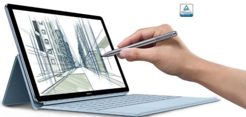
图 2：新款华为 MateBook E 触控操作

高清触屏，多方面提高用户体验。 HUAWEI MATEBOOK E 正面搭载 3:2 比例的 12 英寸高清触控屏，内容显示更加宽广充分，方便文档处理；视野更广的同时，全新 HUAWEI MateBook E 视觉效果更加出色，2K(2160*1440)分辨率，70%NTSC 色域，160° 广视角，350 尼特亮度（典型值）。除此之外，为了缓解长期工作带来的眼部疲劳，MateBook E 具有护眼模式和色温调节功能。在开启护眼模式后，可将有害蓝光的能量峰值降低约 50%，有效缓解视觉疲劳的同时保护用户视力。此外，搭配 2048 级主动式压感手写笔使用，给予消费者多样的操作选择。