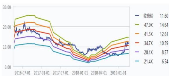
图 1：正股近三年估值（PE）趋势