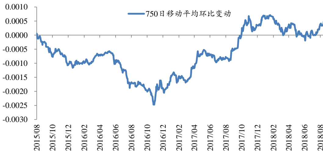
图 2: 750 日国债移动平均环比变动为正