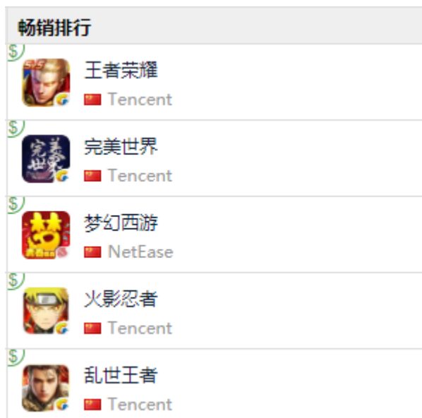
图 13：App Store 中国区畅销榜 TOP5

App Store 2019 年 4 月 19 日数据中国区畅销榜下载量排行前三： 腾讯《王者荣耀》、完美出品&腾讯发行《完美世界》、网易《梦幻西游》。