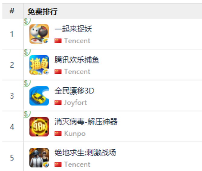
图 12：App Store 中国区免费榜 TOP5

App Store 2019 年 4 月 19 日数据中国区免费榜下载量排行前三： 腾讯《一起来捉妖》、腾讯《腾讯欢乐捕鱼》、乐否《全民漂移 3D》。