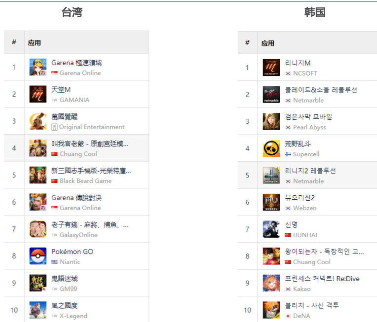
图 15: 台湾和韩国市场 Google 游戏畅销榜排名