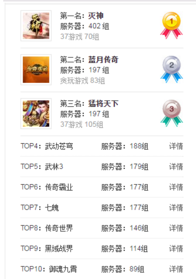
图表8: 2019年第14周(4.08~4.14) 页游排行 TOP10

上周网页游戏开服排行前三为杭州盛游开发的《灭神》、杭州盛和网络科技有限公司发行的《蓝月传奇》和成都阿拉蕾的《猛将天下》;榜单前三游戏共开服 796 组,开服数和前一周保持一致。杭州盛游的《灭神》开服 402 组位居第一;杭州盛和网络科技有限公司发行的《蓝月传奇》和成都阿拉蕾的《猛将天下》分别开服 197 组位居第二、三位。