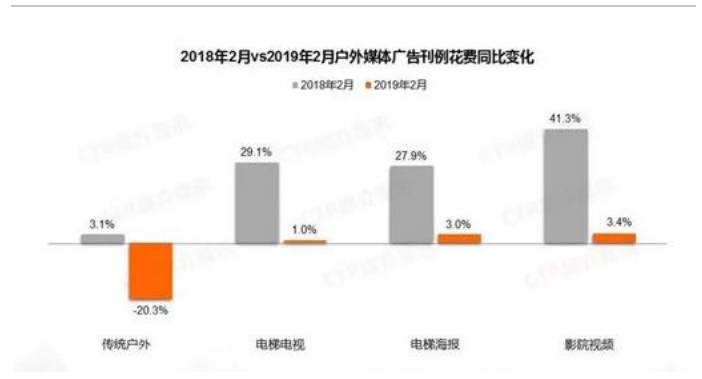
图表10： 户外媒体广告刊例花费