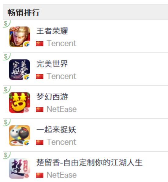
图 13：App Store 中国区畅销榜 TOP5

App Store 2019 年 4 月 26 日数据中国区畅销榜下载量排行前三：腾讯《王者荣耀》、完美世界出品和腾讯发行《完美世界》、网易《梦幻西游》。腾讯《一起来捉妖》排名第四。