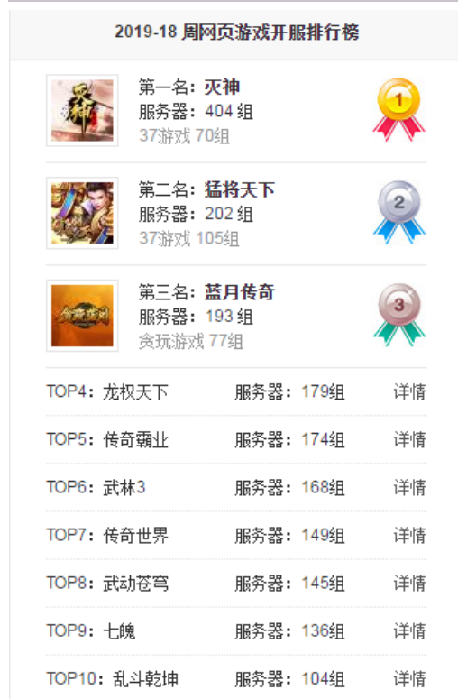
图表8： 2019年第18周（5.06~5.12）页游排行 TOP10

本周网页游戏开服排行前三为杭州盛游开发的《灭神》、成都阿拉蕾的《猛将天下》和杭州盛和网络科技有限公司发行的《蓝月传奇》，和前一周保持一致；榜单前三游戏共开服 799 组。杭州盛游的《灭神》开服 404 组位居第一；成都阿拉蕾的《猛将天下》和杭州盛和网络科技有限公司发行的《蓝月传奇》分别开服 202 组和 193 组位居第二、三位。