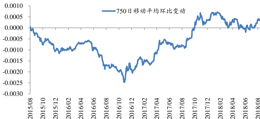
图 2: 750 日国债移动平均环比变动为正