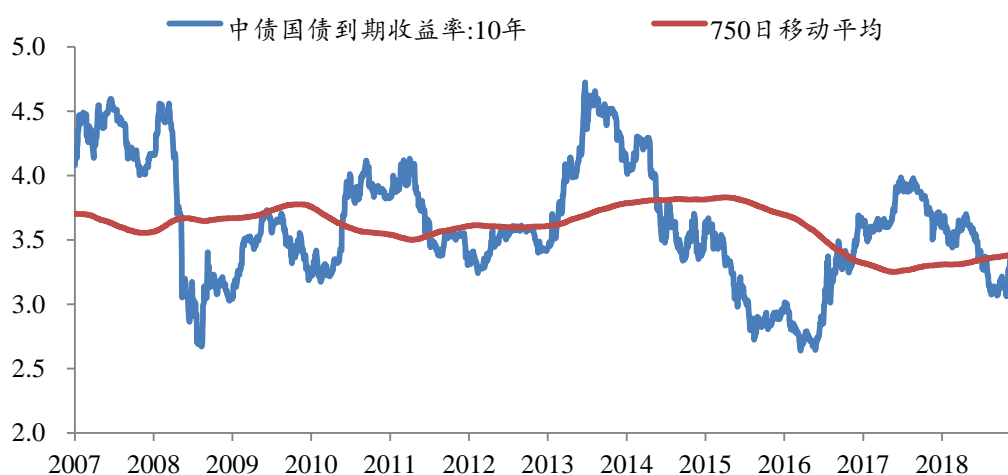
图 1: 目前 10 年国债约 3.3% 位置