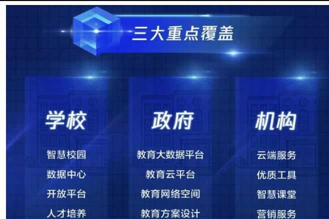
图 2：腾讯教育三大重点覆盖