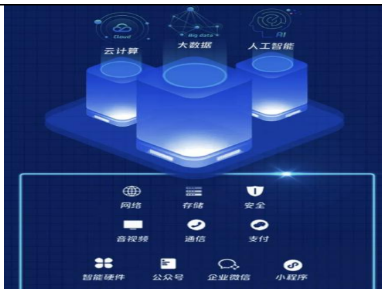
图 3：腾讯教育技术中台

基于智慧教育技术中台，腾讯教育正式宣布成立“腾讯智能教育联合实验室”。该实验室围绕智能管理、智能教学、智能科研三个核心模块，研发产品覆盖学前教育、义务教育、高中教育、高校教育、在职教育五大场景。作为腾讯首个教育行业实验室，其将依托内部的生态资源，用先进技术为教育行业孵化优质 AI 产品。