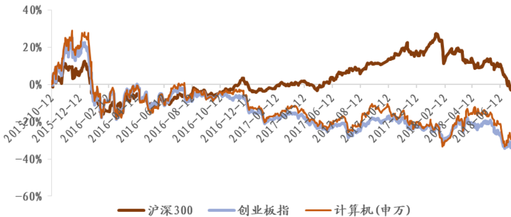
图 1：计算机板块市场表现

上周行情：上周计算机板块上涨 1.82%，相对沪深 300 指数上涨 0.82%，相对创业板指下跌 0.94%。在申万计算机二级行业中，计算机设备、软件开发和 IT 服务板块分别上涨 2.58%、上涨 1.84%、上涨 1.36%，相对沪深 300 指数分别上涨 1.58%、上涨 0.85%、上涨 0.36%。