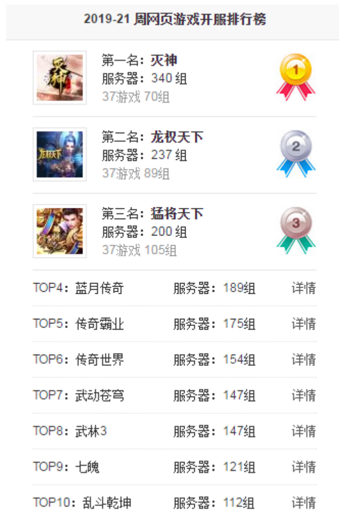
图表8： 2019 年第 21 周（5.27~6.02）页游排行 TOP10

本周网页游戏开服排行前三为杭州盛游开发的《灭神》、上海三七互娱开发的《龙权天下》和成都阿拉蕾的《猛将天下》，榜单前三游戏共开服 777 组。杭州盛游的《灭神》开服 340 组位居第一，较前两周有所下降；三七互娱的《龙权天下》和成都阿拉蕾的《猛将天下》分别开服 237 组和 200 组位居第二、三位。