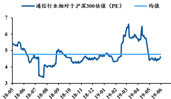
图 2：通信行业 PE

上周通信板块 PE (TTM) 为 52.94X，相对沪深 300 比值为 4.53 倍，低于一年以来均值 4.77 倍；通信板块 PB (LF) 为 2.81X，相对沪深 300 比值为 2.05 倍，高于一年以来的均值 1.91 倍。