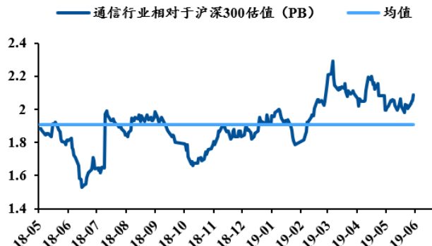
图 3：通信行业 PB