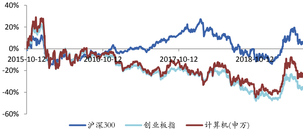
图 1：计算机板块市场表现

上周行情：上周计算机板块下跌 5.29%，相对沪深 300 指数下跌 3.19%，相对创业板指下跌 0.63%。在申万计算机三级行业中，计算机设备、软件开发和 IT 服务板块分别下跌 6.52%、下跌 3.55%、下跌 6.23%，相对沪深 300 指数分别下跌 4.42%、下跌 1.45%、下跌 4.13%。