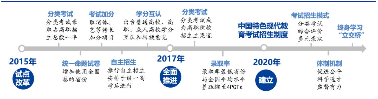
图表1：新高考改革总体目标