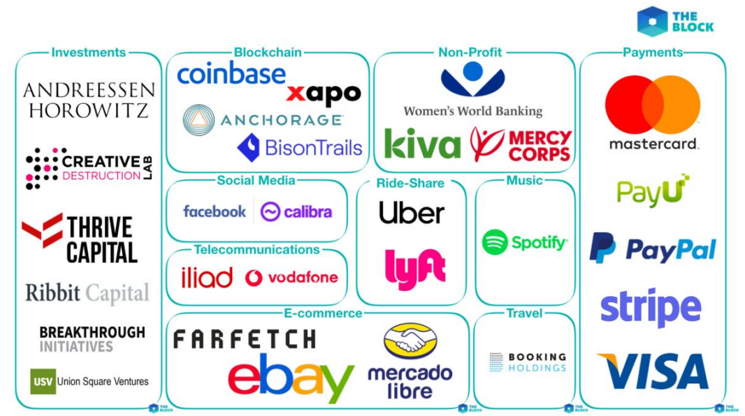
图表 1: Facebook 联合全球 27 个行业巨头成立 Libra 协会, 发布加密货币白皮书