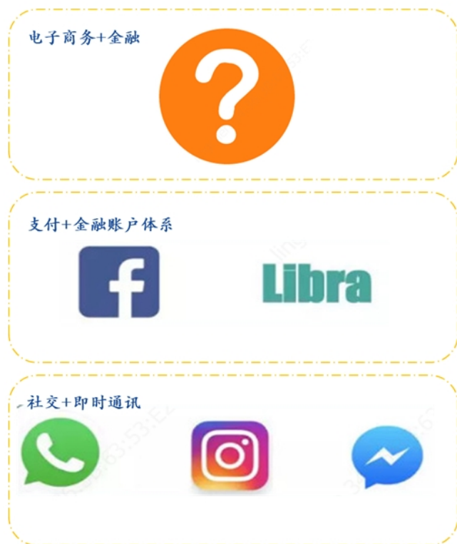
图3: Facebook 产品矩阵

对于 Facebook 而言，Libra 的推出将极大的扩展自身的业务边界。相对于国内 AT 为代表互联网巨头多元化的商业策略以及似乎“无边界扩张”的发展势头而言，Facebook 的主业相对而言更为清晰，通过 Messenger、Instagram 和 WhatsApp 在内产品矩阵，公司打造了全球最大的社交帝国，手握27亿用户，占全球近1/3的人口。当然盛世之下，也有隐忧，尽管 Facebook 已经成为全球最赚钱的公司之一，但是其商业模式还是相对单一，历年都有90%以上的收入来自于广告，而且还在历年增长。最新一季度的财报显示，FB 的营收129.72亿美元中，广告营收占比达到98.5%。面对上述问题，扎克伯格也早已未雨绸缪，开始重新审视其公司的定位，希望进一步扩大自身的业务边界。事实上，在大洋彼岸的微信其实已经展示了社交生态的新图景，在包括了支付、互联网金融、小程序生态之后，微信的定位早已不止于即时通讯和社交，成为了用户生活中不可或缺的部分，而微信的成功一定程度上也让扎克伯格加速了 Facebook 业务升级。显然，Libra 的推出，就是 Facebook 扩展自身业务边界的重要尝试。一方面，支付本身就是个非常大的市场。根据《2017年全球支付报告》的预计，到2020年，全球非现金交易量将达到近7260亿笔。在 Libra 体系内的支付和转账中，Facebook 从中抽取少量的支付佣金费用，本身就将是极为可观的收益。另一方面，通过 Libra，实际上 Facebook 可以构建属于自身的金融账户体系，这将为日后发展电商业务以及金融业务形成重要的铺垫。