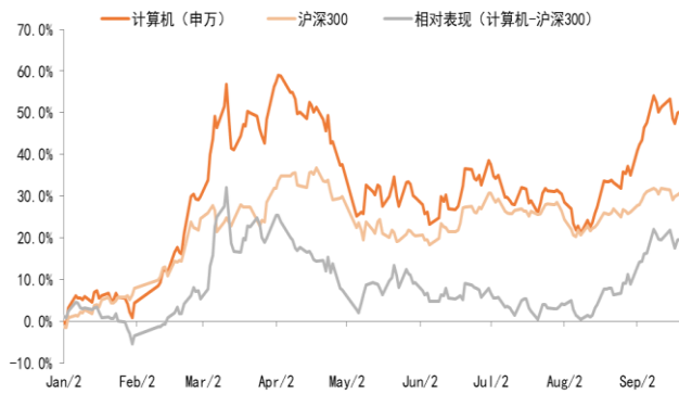
图表1 年初以来计算机行业指数相对表现

上周，计算机行业指数下跌 0.83%，沪深 300 指数下跌 0.92%，计算机行业指数跑赢 0.09pct。年初至上周最后一个交易日，计算机行业指数累计上涨 50.16%，沪深 300 指数累计上涨 30.72%，计算机行业指数累计跑赢 19.44pct。