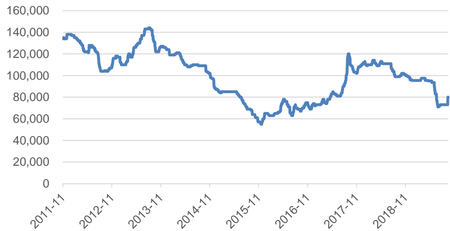
图 2: 2011-2019年钨精矿价格走势 (65%, 元/吨)