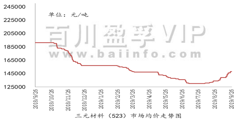
图表3 三元材料价格走势

正极材料市场整体需求回暖，磷酸铁锂需求表现明显，动力三元仍未有明显回暖，国庆节前企业出货稳定，部分厂家暂停发货，订单排到国庆节后，本周企业备货意愿强烈，价格方面，三元材料和钴酸锂市场价格受钴价上涨影响，厂家报价上涨，本周价格逐渐趋稳，实际成交价格略低，具体来看，三元材料现市场报价14.8万元/吨，较上周市场价格上调0.4万元/吨，本周三元材料市场需求逐渐回暖，但动力三元需求并不明显，受原材料价格上涨压力，三元材料厂商报价上涨，实际成交价格略低，预计近期三元材料市场稳中有升，价格继续小幅上涨。钴酸锂市场报价在22.2万元/吨左右，较上周市场价格上涨0.6万元/吨，钴酸锂市场需求稳健，5G推广期内终端成本压力尚可，钴酸锂订单丝毫未受钴价上涨影响，价格顺利上涨，预计近期钴酸锂价格或将继续上涨。磷酸铁锂市场平均报价在4.8万元/吨左右，较上周市场价格持平，磷酸铁锂市场表现平稳，下游电池厂对磷酸铁锂需求明显，随着车企对磷酸铁锂电池成本及性能的青睐，磷酸铁锂订单持续火热。当前碳酸锂价格有止跌迹象，传导至下游磷酸铁锂价格保持坚挺，但下游对成本的要求导致材料涨价难度较大，预计近期磷酸铁锂价格维持稳定。本周锰酸锂市场供应竞争激烈，容量型锰酸锂市场价格微跌，原料碳酸锂价格暂时企稳，锰酸锂厂商低价出货较多，预计近期锰酸锂市场需求尚可，交易价格重心下行。现普通锰酸锂主流报价在2.7-3.5万元/吨，高端报价在4.1-5.1万元/吨。