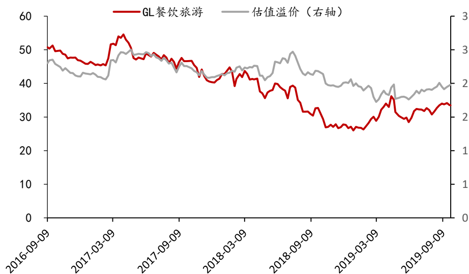
图表 3: GL 休闲服务行业估值情况

GL 休闲服务行业 (31 只) 目前动态平均估值水平为 33.5 倍市盈率, A 股相对溢价较前一周提升。