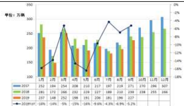
图表二：汽车月度销量变动趋势：