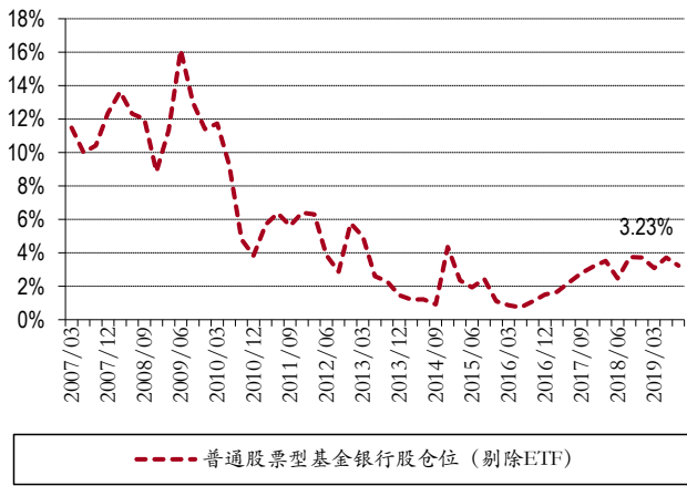
图表 1. 普通股票型基金银行股仓位 (剔除 ETF)