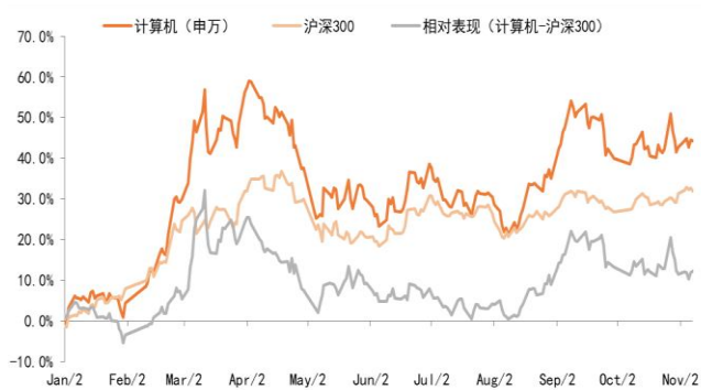
图表1 年初以来计算机行业指数相对表现