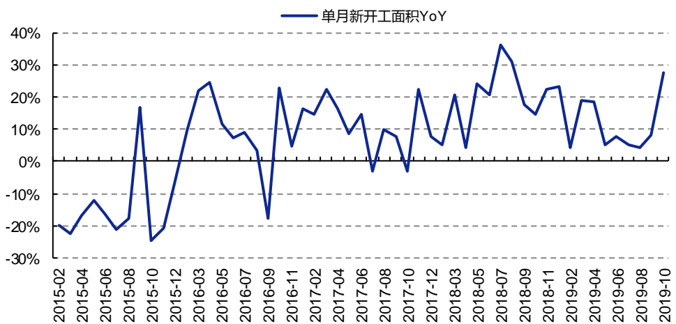
图 3: 10 月新开工反弹