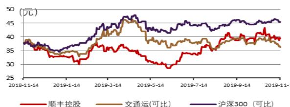
图 2：正股近一年行情图