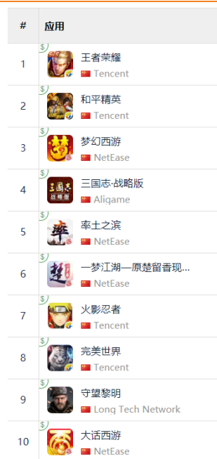
图 13: App Store 中国区畅销榜 TOP10

值得一提的是, 完美世界《我的起源》15 日正式上线后即登畅销榜 13 名, 加上《完美世界》、《神雕侠侣 2》及《新诛仙》, 完美世界已有 4 款游戏在畅销榜前 40 名位置。