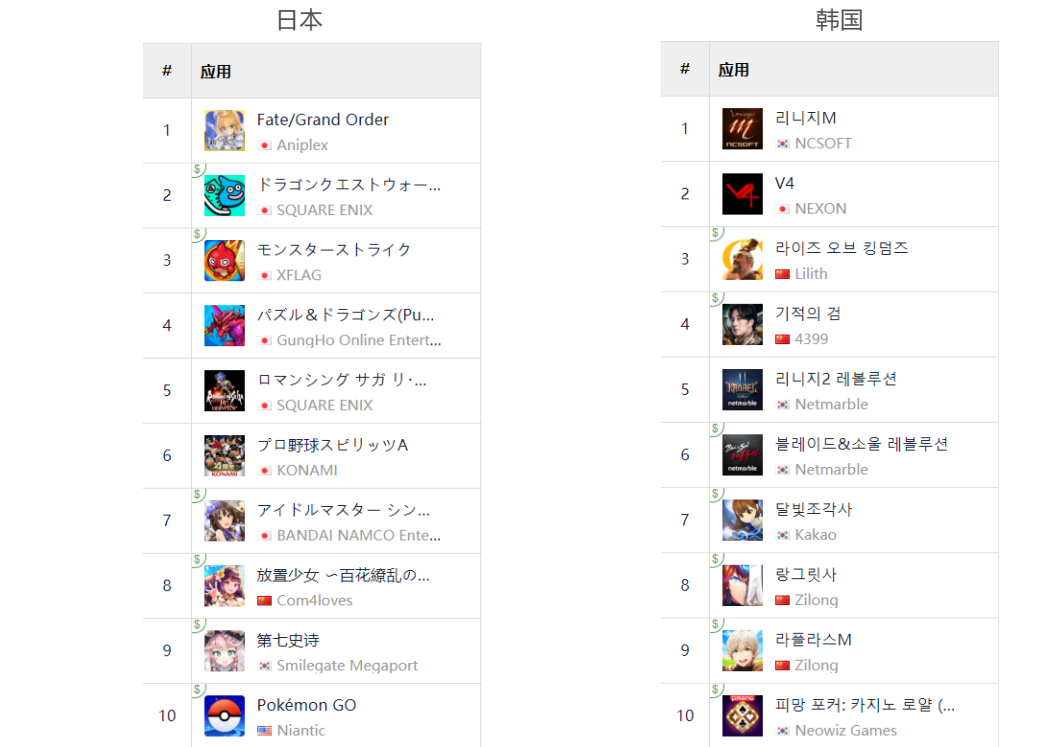
图 15：海外主要市场 Google 游戏畅销榜排名

莉莉丝《剑与远征》、创酷互动《叫我官老爷》、莉莉丝《万国觉醒》、游卡网络《三国杀名将传》在中国台湾市场中分别排名第三、第五、第七、第九。