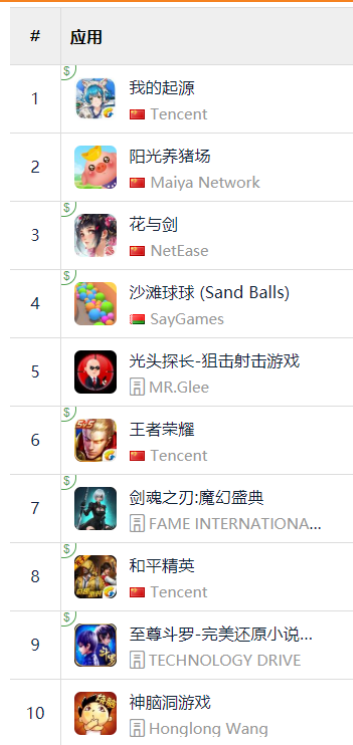
图 12: App Store 中国区免费榜 TOP10