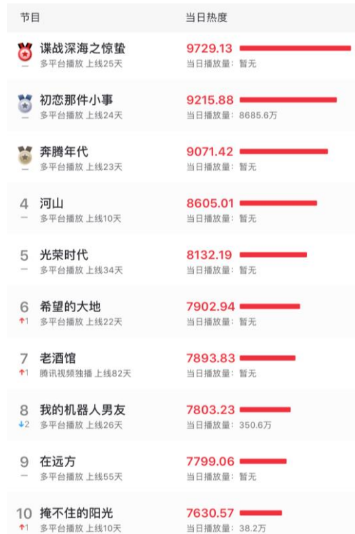
图 4：2019 年 11 月 15 日电视剧热度排名

根据猫眼数据，2019年11月15日（周五）电视剧实时热度排行前三分别为：由千乘影视、新丽电视出品的《谍战深海之惊蛰》排名第一；由芒果超媒、芒果影视、芒果娱乐、沅禾汇文化传媒出品的《初恋那件小事》排名第二；由威克传媒、愚恒影业集团、腾讯影业、红珊瑚传媒出品的《奔腾年代》排名第三。