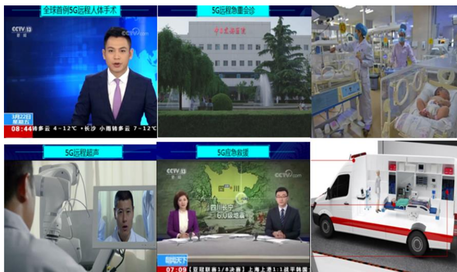
图4：世界5G大会中国移动5G+智慧医疗解决方案

以中国移动为例，移动在此次世界5G大会上展示了一系列的5G智慧医院方案：5G远程人体手术、5G远程会诊、5G远程超声、5G应急救援、VR新生儿探视、急救车全景等。