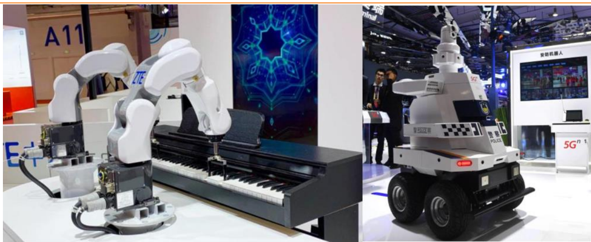
图3：世界5G大会的中兴机器人和无人安防机器人

世界5G大会上，设备商等产业链参与方均展示了工业互联网方面的应用方案，包括无人安防机器人等。