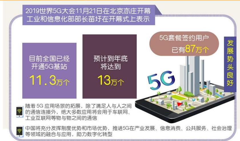
图 3：全国已开通 5G 基站 11.3 万个

上游基础设施逐步完善，5G 大规模商用践行渐近，下游应用加速发展东风以来。此前，2019 世界 5G 大会在京开幕，工信部部长苗圩在开幕式致辞中表示，今年中国政府发放了 5G 的商用牌照，正式启用了 5G 商用服务，目前全国开通 5G 基站 11.3 万个，预计年底将达到 13 万个，5G 套餐的签约用户现在有 87 万个。同时，5G 预约用户超过 1000 万，5G 终端销售超过 100 万部，5G 商用城市达到 50 个。