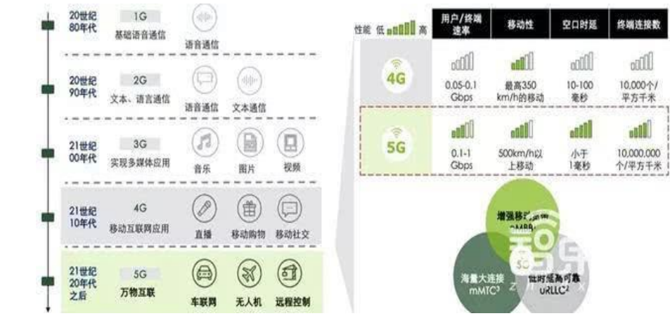
图 2：5G 下游应用异彩纷呈

而 5G 基站储能电源可协助电网调峰，可实现基础资源商业价值最大化。今年 5 月，中国联通与国网公司确定了战略合作关系，在 5G 应用、物联网建设等多个层面建立合作关系。今年 5 月完成了 5GSA 和 NSA 的试验网建设，并开展 5G 网络及业务实验验证。此外还开展基于标准 SA 结构的网络切片验证工作，共同承载 8 类业务应用。今年下半年，国家电网有限公司此前发布的《泛在电力物联网白皮书 2019》显示，国家电网将在 2 年内初步建成泛在电力物联网。最终目标是实现电力系统各环节万物互联、人机交互，形成“数据一个源、电网一张图、业务一条线”。