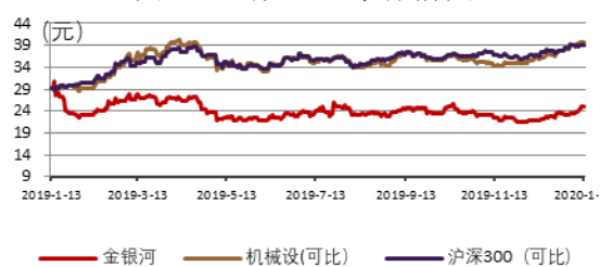
图 2：正股近一年行情图