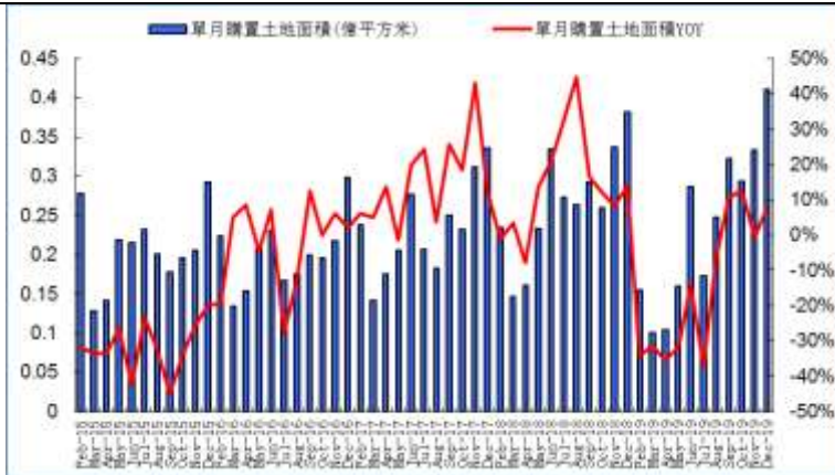
图3：单月购置土地面积及增速(亿元、%)