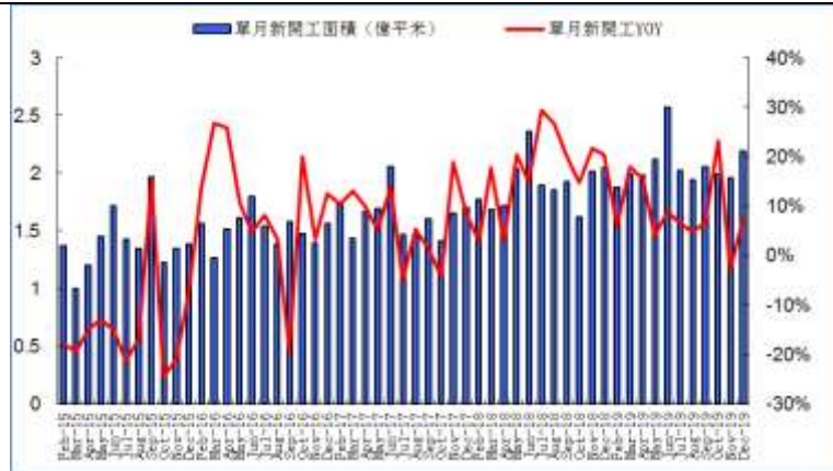
图4：单月新开工面积及增速（亿平米、%）