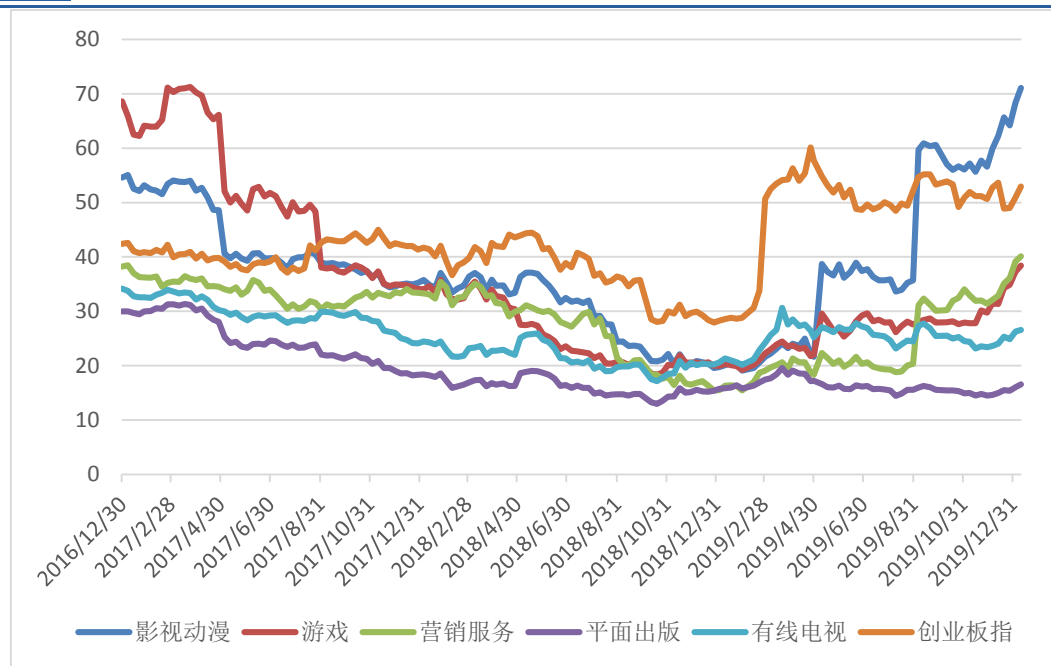
图 1: 2017 年初至今互联网传媒细分行业 PE 估值变化情况