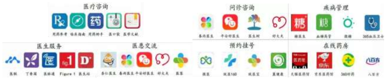
图 1: 互联网医疗代表厂商

相关企业在疫情宣传和辟谣方面也贡献力量，如丁香医生做出了疫情分布图的实时更新小程序，腾讯结合腾讯医典推出了实时辟谣的链接，帮助大众鉴别疫情信息和相关知识。