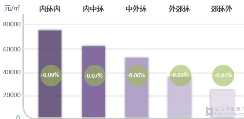
图：环线均价及环比变化

2020年4月1日，各环线基价均值继续稳中有跌。虽然从近期成交均价来看，各环线都有不同程度的上涨，但主要是成交结构上移、次新小区成交增加所致，整体市场价格水平仍以稳定为主。