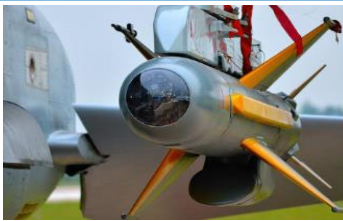
图 8：空对面导弹近照