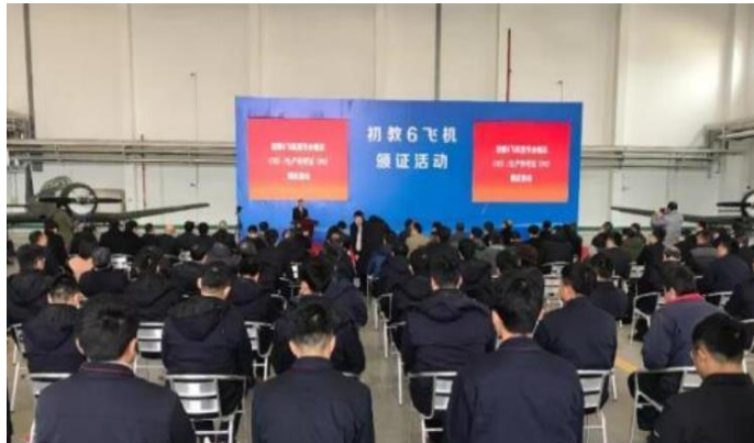
图 4：初教六获得民航适航认证