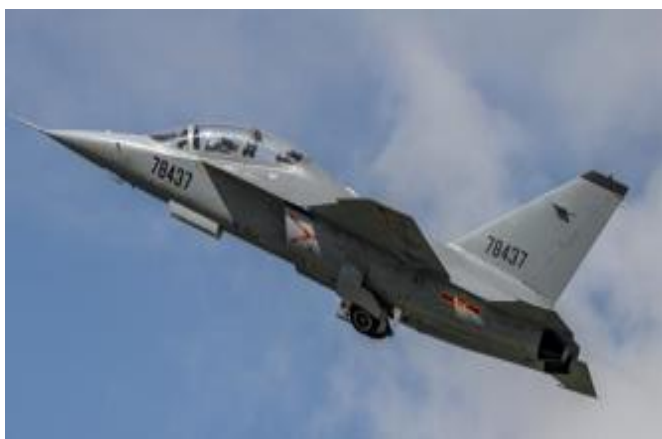
图 1：洪都航空的高级教练机：高教-10

高教-10高级教练机进入批量列装阶段。 近几年来，以歼20、歼16、歼15等先进作战飞机批量列装空、海军。原来从作战部队选拔优秀飞行员，作为歼20等先进作战飞机飞行员的培训方法不能持续。空军、海军都开始加大直接从航校培训新型战机飞机员的力度。公司的高级教练机型号：高教-10在气动性能、航电设备、操作模拟等方面都可以很好的完成4代机和3代半战机的前期培训工作。伴随高教-10近两年已经进入批量列装阶段，洪都航空（600316）经营最困难的时候已经过去。