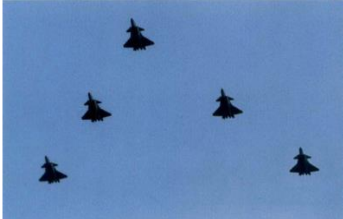
图 2：国庆阅兵上的歼-20