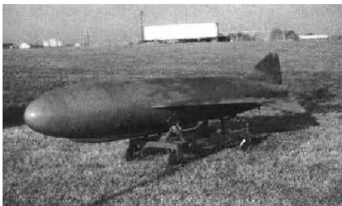
图 5：中国第一款飞航式反舰导弹“上游-1 号”（1967 年定型）

洪都集团是中国传统的反舰导弹研制生产基地。在航空工业体系内，与其他飞机主机厂只研制生产飞机不同，洪都集团在研制生产飞机以外，还有历史悠久的导弹研制生产业务。洪都集团的导弹业务可以上溯到上世纪 50-60 年代。中国第一款飞航式反舰导弹“上游-1 号”就是诞生在南昌。