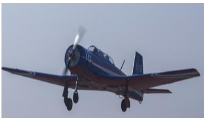
图 3：洪都航空的初教六飞机

都航空（600316）在 2020 年上半年完成转场交付任务的数十架飞机中，初教-6 的新增订单也为公司业绩增长提供了新的动力。