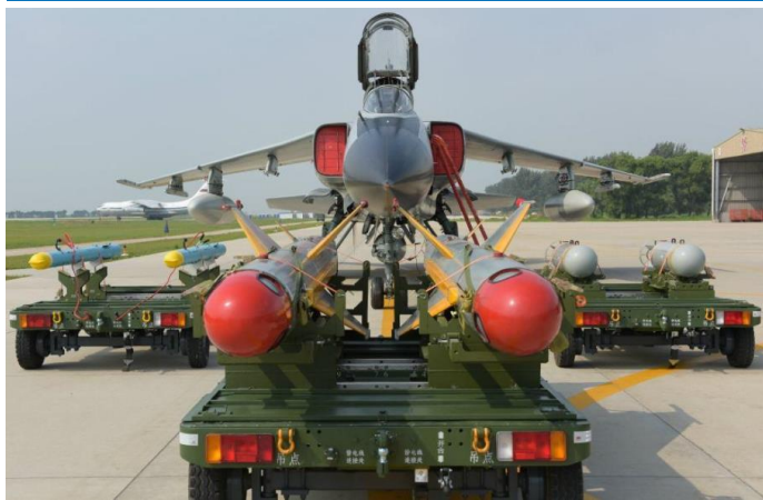
图 7：歼轰-7 装备的空对面导弹