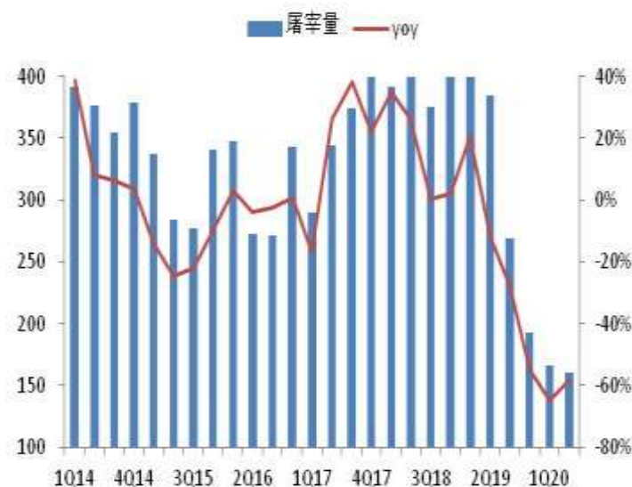
图1：屠宰量变动 单位：万头