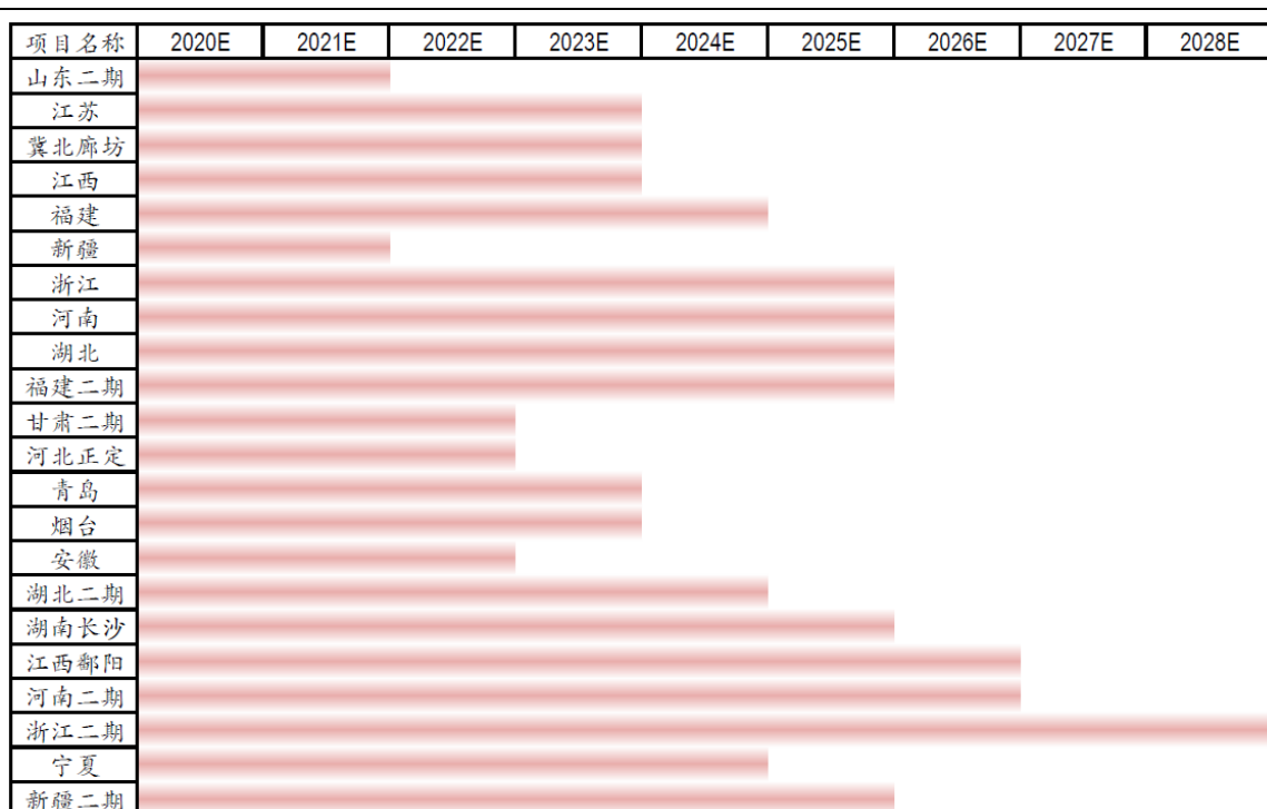
图表 2. 公司部分在手项目效益分享期示意图