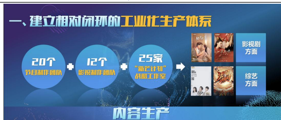
图1： 芒果超媒相对闭环的工业化生产体系

1. 建立相对闭环的工业化生产体系。 芒果掌控内容生产的全部流程和各个环节，以低成本、独特眼光、差异化打法创造出内容爆款。目前公司有 20 个节目制作团队、12 个影视制作团队和 25 家“新芒计划”战略工作室，还成立了音乐、导摄等多维工作室。2020 年上半年，芒果 TV 在用户观看时长综艺 TOP10 中占据 5 席，TOP100 中占 46 席。影视剧也形成了良性的自有生态，《韞色过浓》《一夜新娘》等多部定制剧表现出色。