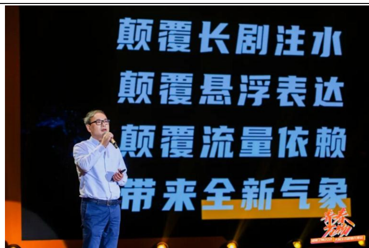
图3： 芒果超媒布局短剧，推出“季风计划”

“芒果季风计划”打造国内首个台网联动周播剧新样态。2020年9月22举办的招商会上，芒果TV推出季风计划全力打造超级剧场，具体做法是联动湖南卫视与芒果TV，以“高创新、高品质、高稀缺”为标准，共同打造国内首个台网联动周播剧新样态。“四大季风、四季联排”，十部短剧贯通2021年，其中每季12集，每周2集，每集70分钟。