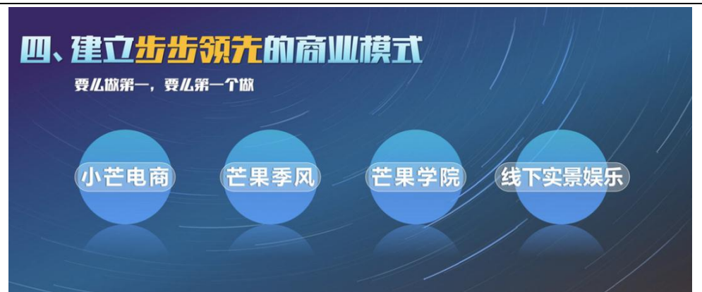
图2： 芒果超媒步步领先的商业模式

4.建立步步领先的商业模式。 今年公司开始全力打造基于长视频内容的“小芒”垂直电商平台，进一步深化内容、平台和品牌的联合影响力；重构影视剧生产体系，启动“芒果季风计划”；升级“大芒计划”，打造“芒果学院”，将UGC内容爱好者培养成顶级PGC制作人；聚焦悬疑IP，打造明侦剧本杀主题店，探索线下实景娱乐。新赛道和新布局让芒果生态更完善，商业变现更多元，品牌影响更强大。