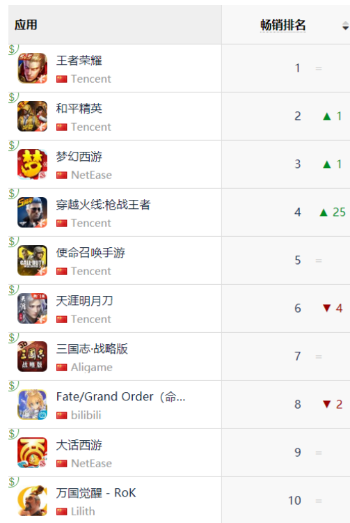
图 10: AppStore 中国区畅销榜 TOP10