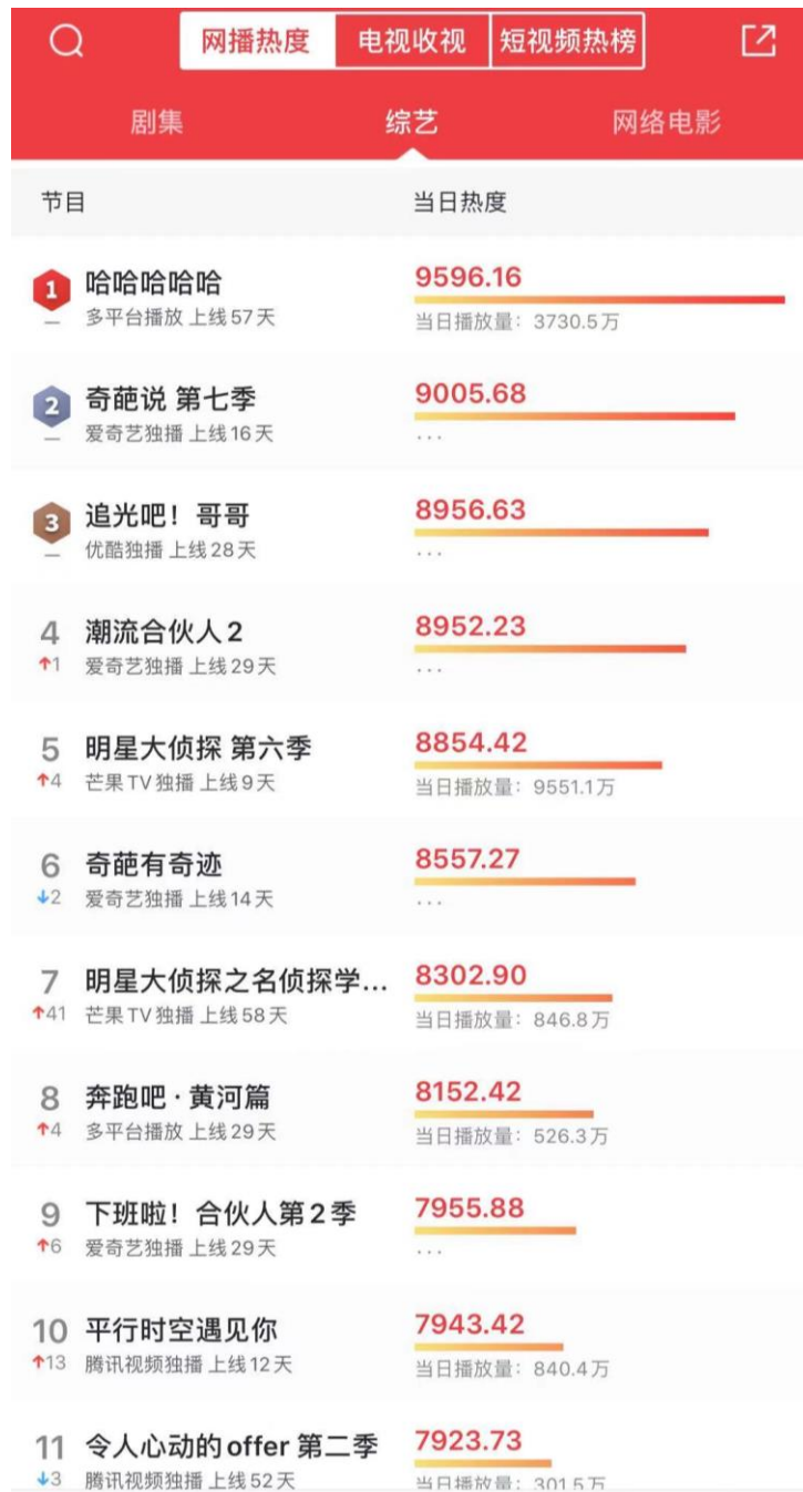
图 6：2021 年 1 月 1 日（周五）综艺栏目热度排名