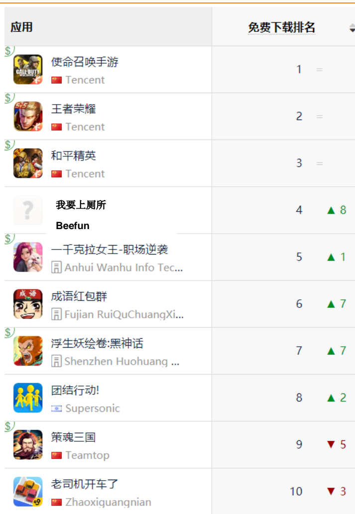
图 9: AppStore 中国区免费榜 TOP10