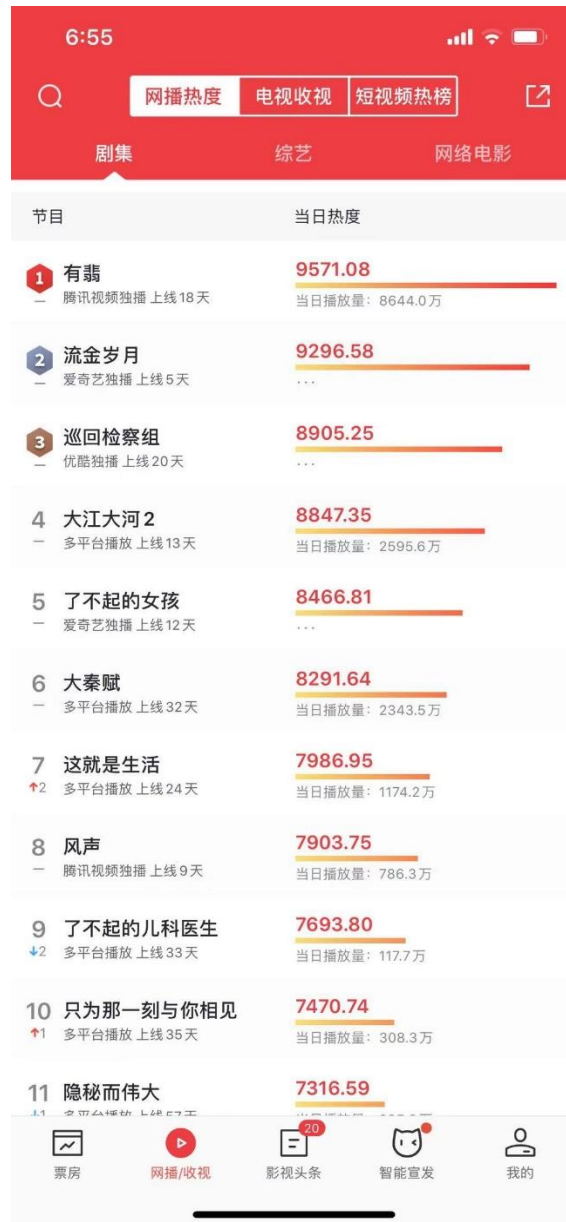
图 2：2021 年 1 月 1 日（周五）电视剧热度排名

根据猫眼数据，2021年1月1日（周五）电视剧实时热度排行前三分别为：由华策影视、上海克顿等出品的《有翡》排名第一，由新丽电视、上海瞳盟影视、居正影业等出品的《流金岁月》排名第二，由最高人民检察院影视中心、中共山东省委宣传部、金盾影视、湖南广播等出品的《巡回检查组》排名第三；