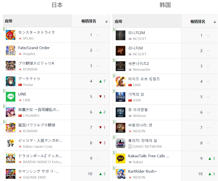
图 12: 海外主要市场 GooglePlay 游戏畅销榜排名