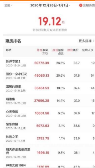
图 1：2020 年 12 月 26 日-2021 年 1 月 1 日电影票房排名

根据猫眼数据，2020年12月26日（上周六）至2021年1月1日（本周五）全国总票房为19.12亿元，票房前三分别为由寰宇娱乐、阿里巴巴、博纳影业出品的《拆弹专家2》（5.08亿）、由横店影业、联瑞（上海）影业、儒意影视出品的《送你一朵小红花》（4.91亿）、由爱美影视、华谊兄弟、淘票票影视出品的《温暖的抱抱》（3.55亿）。