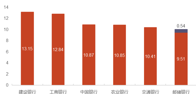
图 1：邮储银行定增后资本充足水平与同业比较（单位：%）

资料来源：公司财报，光大证券研究所；红色柱子表示各家行 2020Q3 核心一级资本充足率，蓝色表示邮储银行定增完成后预计提升的核心一级资本充足率